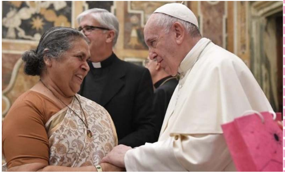
ടനക്ക് ഇന്നു സാന്നിധ്യമുണ്ട്.